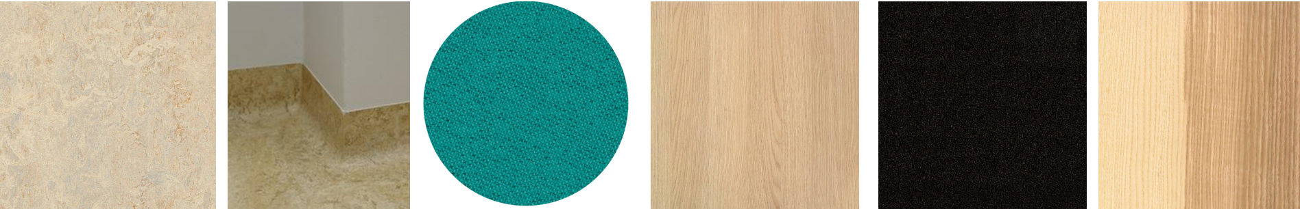
podlaha sokl látka lamino - nábytek kovové prvky dřevo