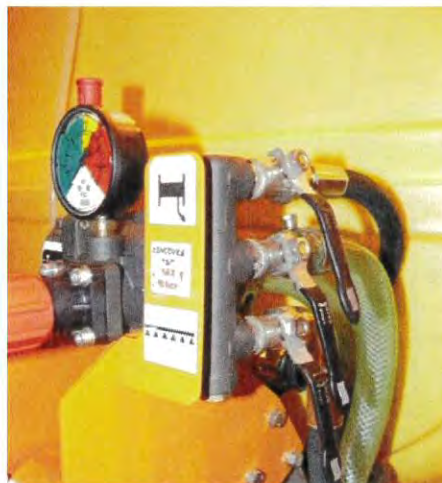
Připojení nástavby cisterny velikosti „C“