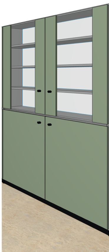
vizualizace uzamykatelné skříně

Před zahájením výroby, objednáním, nebo zabudováním PSV. budou na stavbě ověřeny stavební rozměry, způsob zabudování a stavební návaznosti a barevné řešení. Součástí dodávky výrobků bude i dílenská dokumentace výrobků PSV. Dílenská dokumentace bude předložena k odsouhlasení investorem a architektem stavby. Veškeré výrobky, pohledové materiály, spoje, styky atd. budou na stavbě vyzorkovány a odsouhlaseny autorem návrhu. Nedílnou součástí projektové dokumentace je D.1.1a - Technická zpráva a D.1.3 - Požární bezpečnostní řešení i jiné související části projektové dokumentace.