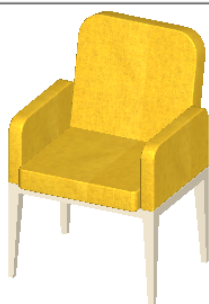
vizualizace polstrované židle

materiál: dřevo bělený buk + polstrování čalounění: odolnost vůči oděru, využití materialu zpomalující hoření(DIN 4102) barva světle žlutá* výška sezení min 460 mm