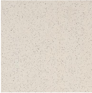
dlažba / obklad