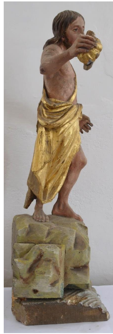
Sousoší Křest Kristův (zde socha sv. Jana Křtitele) z kostela sv. Jakuba v Poličce.