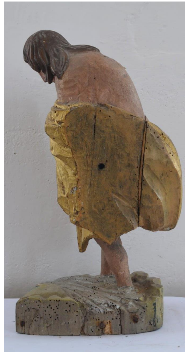
Sousoší Křest Kristův (zde socha Krista) z kostela sv. Jakuba v Poličce.