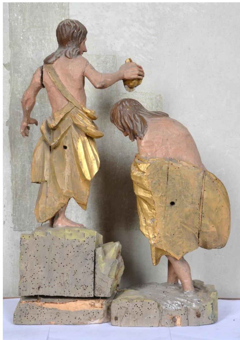
Sousoší Křest Kristův (kompletní) z kostela sv. Jakuba v Poličce.