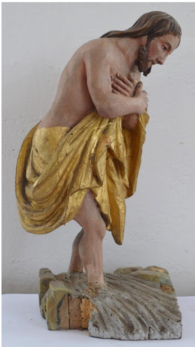
Sousoší Křest Kristův (zde socha Krista) z kostela sv. Jakuba v Poličce.